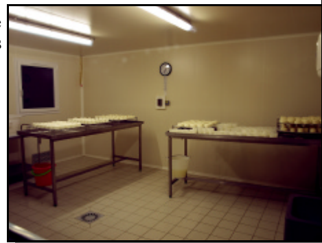
Le labo: nickel-chrome!

Les produits finis portent le nom de "Lactic" (pour les fromages) ou de "Faisselles de Champ Marin".