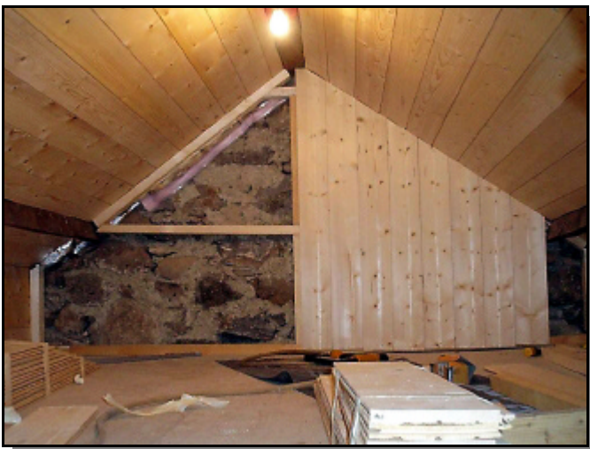
L'aménagement des combles en cours de finition.

Une équipe de bénévoles conduite par notre employé communal Hervé a poursuivi les travaux à la cabane en septembre.