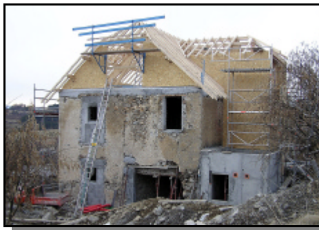
La cure: un bel exemple de réalisation éco-énergétique.