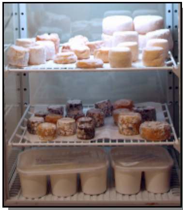
La production: les Lactic à différents stades d'affinage. En bas, les faisselles.

Après plusieurs années d'étude en milieu agricole, Aurore prolonge avec bonheur une longue tradition familiale dans le milieu ovin.