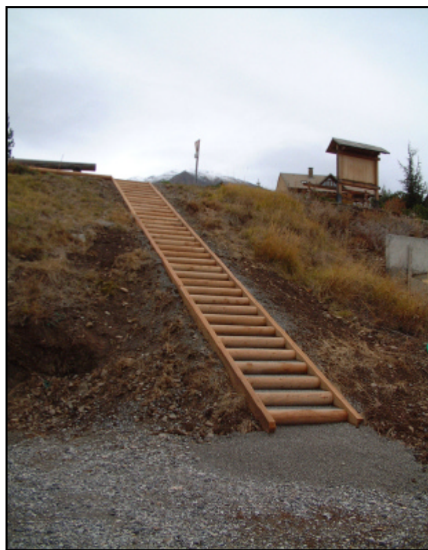
Un escalier de 34 marches au Pibou: seul Hitchcock avait fait mieux avec ses 39 marches!