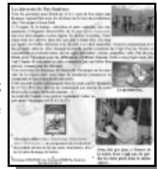
VERSANT SUD N°3

Septembre 2001, souvenez-vous: VERSANT SUD s'était invité chez Véronique Dubourg pour une visite guidée de la chèvrerie de Puy Sanières. Aujourd'hui c'est Aurore Lagier qui nous accompagne pour nous présenter sa fromagerie aux Bouteils, ouverte depuis deux mois. Son cheptel est constitué de 115 brebis laitières de race Lacaune (race de souche aveyronnaise, à l'origine du fromage de Roquefort).