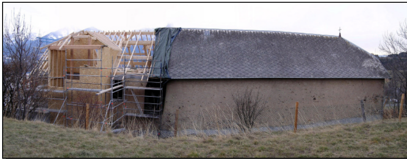
État des travaux à la cure le 12 décembre.