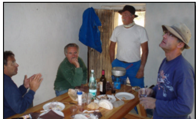
Réunion de chantier!